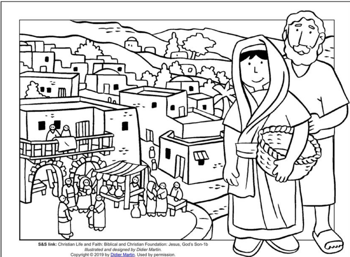
S&S link: Christian Life and Faith: Biblical and Christian Foundation: Jesus, God's Son-1b Illustrated and designed by Didier Martin. Copyright © 2019 by Didier Martin. Used by permission.

Kaart: https://assets.churchofjesuschrist.org/07/8b/078b3afada27f1b065c9531e975c6bbb0800307f/map_holy_land.png