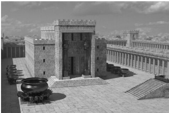
Saalomoni-aegne Jerusalemma tempel.

Tänapäevane Nutumüür on väidetavalt templist säilinud osa, mis on juutide jaoks püha koht.