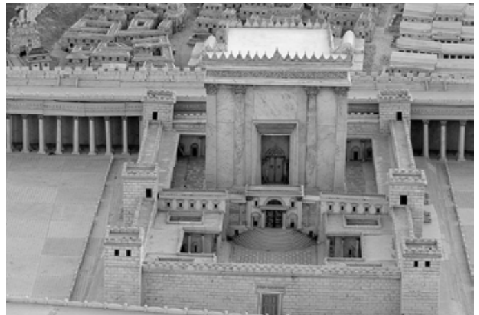
Jeesuse-aegne Jerusalemma tempel.

Illustratsioon: https://freebibleimages.org/illustrations/bs-solomon-temple-outer/?fbclid=IwAR0T30UuufPnWwdh0qjCu6_5PI0tWad7oi8yDf6yosqmNI7tdpPitWzwZj0