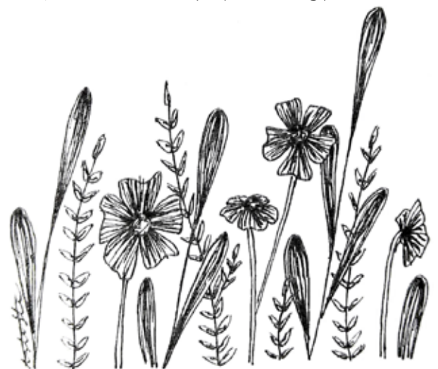
Illustratsioon: Tiril Synøve Tøfte

Igal inimesel on igapäevaelus toime tulemiseks vajalikke ja kasulikke omadusi, kuigi mõnel rohkem ja teisel vähem. Kõik ei ole kõigi jaoks. Seevastu pole piirangut selles, et olla veel enam inimene ise, olla veel enam Jumala-näoline, olla armastus, rõõm, rahu, pikameelsus, lahkus ja heatahtlikkus. Selleks pole vaja midagi saavutada või endale hankida. Selleks on lihtsalt olemine Jumalas, meie Loojas ja Õnnistegijas.