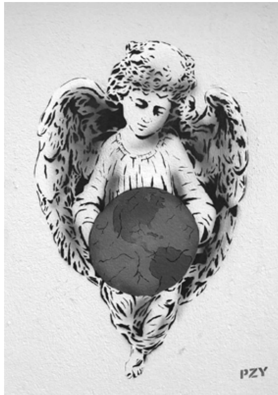
Fotol detail Stavangeri tänavakunstist Norras.

Ka uuema teoloogia keskmes on Kristuse isik ja tema kaudu toimunud lunastus. Probleem on aga, kuidas selgitada seda inimestele, kelle maailma- ja inimesepilt erineb oluliselt antiikaegsete inimeste omast ja keda pildid ohvrast ja saatanalike vägede alistamisest ei kõneta enam sel kombel, nagu need kõnetasid inimesi ajal, mil Uue Testamendi teosed kirjutati. Tänapäeva piiblihermeneutika lähtub sellest, et usu keel, mida kasutab ka Uus Testament, on müütiline või sümboolne, kasutades pilte ja sümboleid, mis on tekkinud konkreetsetes ajas ja kultuuris ning on mõistetavad vaid sellega arvestades. Piiblihermeneutika püüab sõnastada nende piltide ja sümboolite erinevaid tähendusi, süstemaatiline teoloogia aga reflekteerib nende tähenduste üle. Järgnevalt vaatleme mitmeid Uues Testamendis ja kristlikus pärimuses Jeesuse kohta esitatud väiteid ja püüame avada nende sügavamat sisu. (Järgneb)