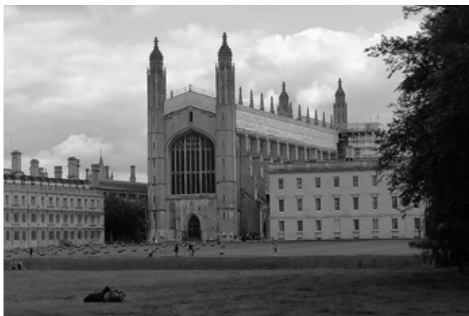
King's College, Cambridge'i üks tuntumaid kolledžeid.