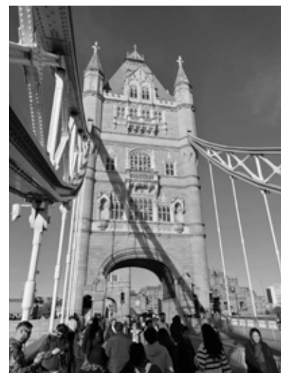
London, Toweri sild.

Ma elan Wimpole'i külas, mis asub umbes tunniajase bussisõidu kaugusel Cambridge'ist. Küla lähedal on looduskaitseala koos uhke mõisahoone, kiriku ja vana pastoraadiga, kus