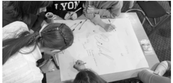
Noorteleeri tund.

Ühel sügispäeval nägin ma nägemust Kristuse haavatud verisest ihust ja küsisin, mida see tähendab? Ja vaikusest kostis tasane Issanda hääl: "Iga kord, kui mu lapsed on omavahelises riius, haavab see minu ihu."