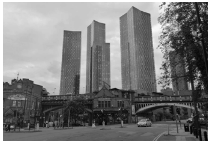
Manchesteris kohtuvad vana ja uus.