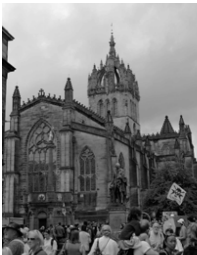
Edinburgh, Püha Giles'i katedraal.

Väga hea mulje on jätnud mulle Inglise Kirik, mida laiemalt tunneme anglikaani kiriku nime all. Inglismaa on vana kristlik maa, kuhu ristiusk jõudis juba ajal, mil Inglismaa kuulus Rooma keisririiki. Sellest ajast on säilinud palju mälestisi ja kuna olen Rooma ajaloo uurija, tunnen sellest suurt rõõmu. Nii võib Bathis külastada rekonstrueeritud Rooma terme ning St Albansis vaadata Rooma teatri varemeid ja kauneid Rooma keisririigi aegseid mosaiike. Linn ise on saanud nime siin 3. sajandil hukatud kristliku märtri Albanuse järgi, kellele on pühendatud ka linna katedraal. Rooma keisririigi lõpule (5. sajandil) järgnenud perioodil hakkas ristiusk kiiresti hääbuma, kuna tollal Inglismaale tunginud anglosakside vallutajad ei olnud kristlased. Seepärast algas siin 6. sajandil Rooma kiriku misjonitöö, mille tulemusena ristiusk hakkas uuesti levima, leides toetust ka kohalike valitsejatel. Varasel keskajal (6. ja 7. saj) rajati Inglismaale rohkesti kirikuid ja kloostrid, millest paljud on kas varemetena või uuematesse kirikuhoonetesse sisseehitatutena säilinud tänaseni. Kõrgkeskajast (12. ja 13. saj) pärinevad siinsed uhked katedraalid, mida saab imetleda paljudes linnades. Kloostritest on seevastu suurem osa hävitatud. 16.