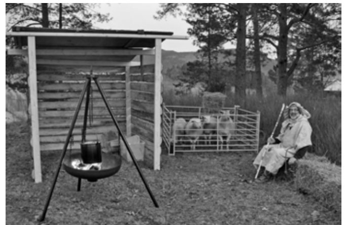
Igal aastal enne jõule tulevad lasteaija- ja kooligrupid jõulumatkale ning Ivar võtab lapsi vastu karjasena.

Just neid õnnistavaid silmi me tallis kohtamegi – edastatud meile väikese ja kaitsetu lapse kaudu.