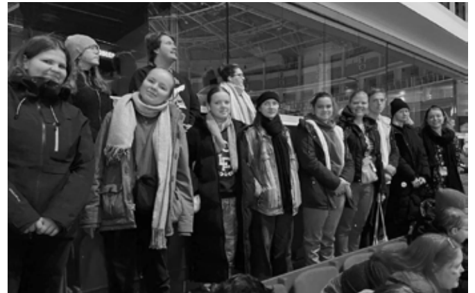
Soomes Maata Näkyissä festivalil.

Septembrikuu noorteõhtu teema oli "Uus algus" ja kuu lõpus osalesime taas Pauluse päeval Tartus. Oktoobris soovisid noored vaadata filmi "Süü on tähtedel". Kuu lõpus, kui hakkas lähenema hingedeae, oli noorteõhtu teema "Surm ja elu". Novembris sai juba Martha ülesande teha noortekat ja teemaks kujunes "Kahe riigi kodanik", mille ta sidus ka isadepäevaga.