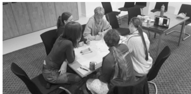
Noorteleeris osalejad tunni ülesannet lahendamas.

Nelipühäl anti koguduses leeriõnnistus kahele toredale inimesele ning ristimise läbi sai üks noor kogudusse vastu võetud. Veel üks noor võeti ristimise läbi vastu koguduse aastapäeva jumalateenistusel, 26. novembril. Mitmed noored kasvasid suveks välja lastekirikust ning sügisel alustas uus suveni kestev noorte leerigrupp.