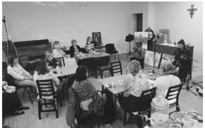
Loominguõhtu.