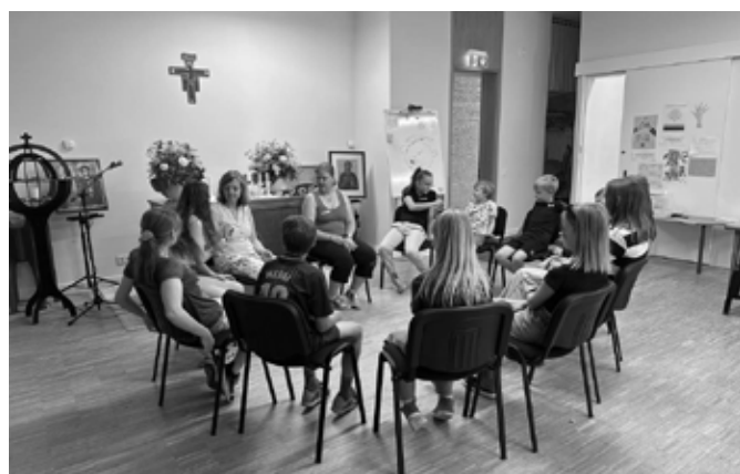
Suvine lastelaager.

Koguduse linnalaagri korraldasime tavapäraselt juunis enne Võidupüha ja see oli selle tõttu tavapärase viie päeva asemel 4-päevane. Need päevad sisustasime "Kadunud poja" tähendamissõnaga ning bowling'u, Proto avastuskeskuse, Arvo Pärdi keskuse ja Nõva