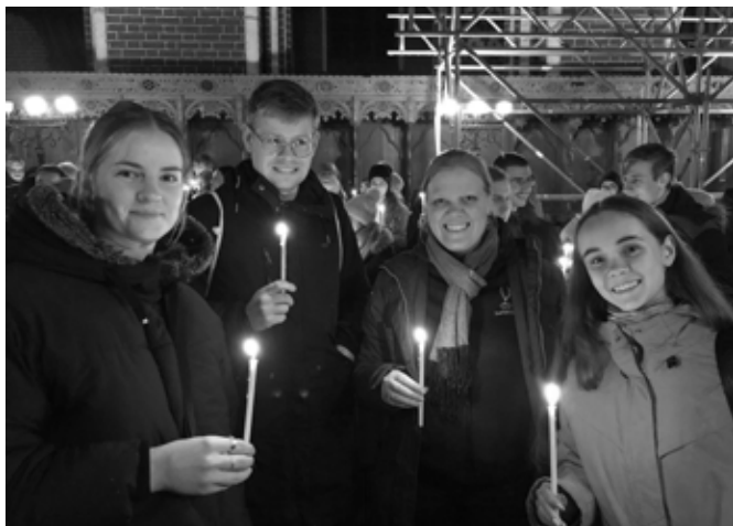
Taizé noorte aastavahetuskohutamine Rostockis 2022/2023.