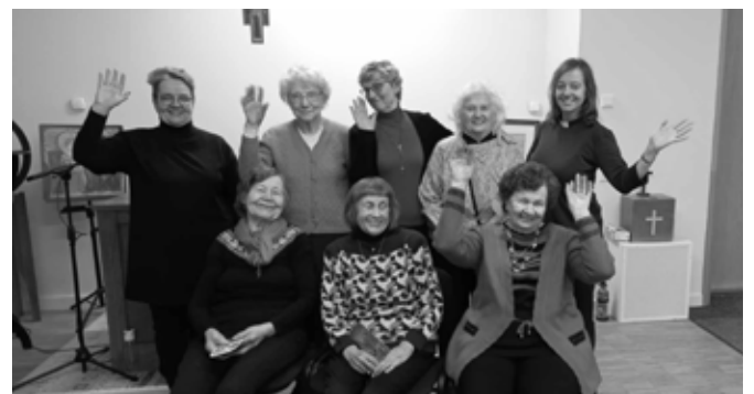
Elurõõmsate ja tegusate jõulukohtumine.

Eriline ja oodatud on aasta viimane, jõulukuu koosolemine kingipakkide ja piduliku lauaga. Kirjutame ühise jõululuuletuse pikale paberilehele, kus iga järgmine kirjutaja lisab omalt poolt midagi riimuvat eelmisele.