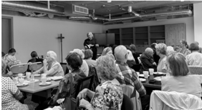
Kohtumisõhtu "Eluleib".

24.-27. augustini toimusid Mustamäe Kirikupäevad alapealkirjaga "Eluleib". Elus on oluline kanda hoolt nii keha kui ka vaimu eest ja neid toita vaid parimaga ning nelja päeva jooksul said kosutust mõlemad. Peamiselt toimus tegevus Mustamäe kirikus ja selle ümbruses, üritusele oli kaasatud ka Mustamäe Kristlik Vabakogudus.