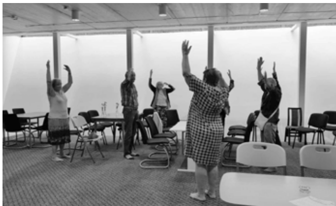
Eakate mälu treening.