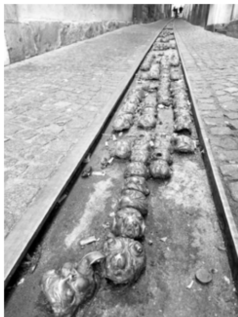
Ljubljana vanalinna Lukkseppade tänava sillutis kannab 700 eriilmelise näo kujutisi. Pikk ja kitsas tänav viib lõpuks veekaevuni.

Mind ennast on aastaid toetanud üks vaimulik harjutus. Panin sellele nime „Valgus tunneli lõpus“. Kuna ilmad on talve lõpule omaselt vihased, külmad ja tuulised, kohati veel jäised ja libedad, saab seda harjutust teha soojas toas diivanil või tugitoolis mugavas asendis istudes. Oluline on iga kord jõuda valguseni. Ülestõusmise valgus paistab tunneli lõpus, sest juba märtsi viimasel pühapäeval tähistame ülestõusmispüha.