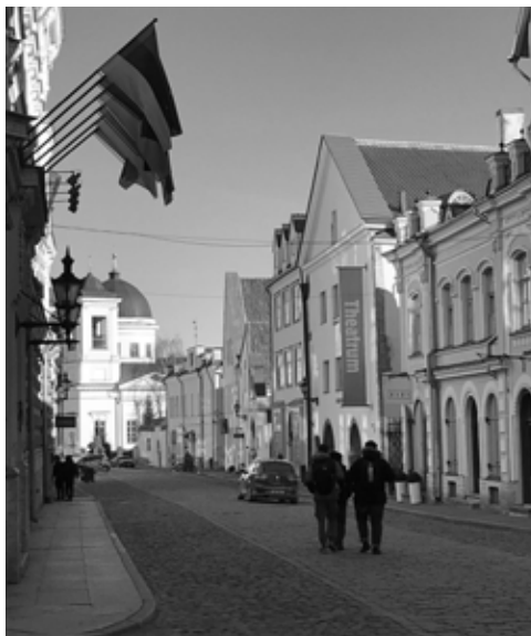
Tallinna Vanalinna Vene tänav.

paremalt vasakule. Ega lastele seal koolis just ristimärki õpetata, nad lihtsalt näevad, kuidas usklikud õpetajad hommikupalvustel teevad, ja nüüd – kodukiriku pühalikul üritusel – löi Taavil see meelde kulunud liigutus välja. Juhtum valmistas mulle päris nalja, kuigi algul ehmatasin, et „oi, mis ta nüüd tegi”. Tütar aga rääkis kunagi, et päris väiksena arvanud ta ülestõusmispühade ajal, et me hakkame iga pühapäev mune värvima. Mina muutusin väga kurvaks, et laps lootis nii ja ei rääkinud sellest kellelegi. Tema aga ütles rõõmsalt, et ei, ta ei olnud selle pärast üldse põdenud. Iga pühapäeva võib võtta ülestõusmispühana, isegi igat päeva. Niisiis – rõõmustagem!