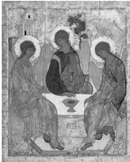
Andrei Rubljovi ikoon "Kolmainsus"

Kõik kolm kristlikus kirikus heaks kiidetud usutunnistust – apostlik, Nikaia ja Athanasiose usutunnistus – tunnustavad kolmainsusest. Kolmainupühäl tuleme meelde, et kristlik usk on usk ainsasse Jumalasse tema kolmes isikus ehk olemisviisis.