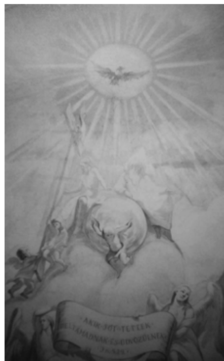
Laefresco kolmainsusest Rumeenia kirikus.