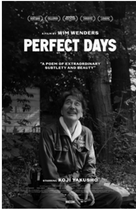
Wim Wendersi filmi "Perfect Days" filmiplakat ( https://www.imdb.com/title/tt27503384/mediaviewer/rm3860354817/?ref_=tt_ov_i )

See on lugu keskealisest mehest Hirayamast, kes teeb väga madalalt hinnatud tööd – puhastab ja hooldab ühe Tokio linnaosa tualettruume. Hirayama elab tööliiskvartali väikses ja lihtsas korteris. Tal on vähe asju ja needki ei ole enam uued. Päevad mööduvad rutiinselt, iga päev samad tegevused ja samad kohad. Igav? Nii võib tunduda meile. Hirayama jaoks aga on päevad täidetud hea ja ilusaga, ta on rahul igas hetkes ja oma vaiksusel kombel on ta õnnelik. Igal hommikul naeratab mees uuele päevale. Igal lõunal pildistab ta pargis läbi puuokste paistvat päikesevalgust. Ta räägib vähe, aga märkab palju. Ta märkab väikseid asju, mida teised ei pane tähele. Asju, mida me võtame enesestmõistetavana, asju, mis on olemas ainult hetke,