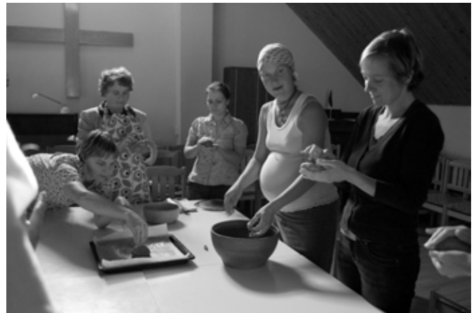
Mustamäe koguduse esimene leivategu Nõmme koguduses.

Oma rännakut alustades oli üks meie soovidest, et Mustamäe kirik võiks olla justkui oas, mis toidab kõiki, kes siit uksest sisse ja välja käivad. See unistus sai kirja pandud juba meie koguduse rajajate esimesel kohtumisel. Soovisime, et tuleviku kirikus oleks alati Eluleiba, mis toidab ja annab lootust igale inimesele, kes kiriku uksest sisse astub. Koguduse igapäevaelu kujunes aga nii, et me hakkasime alati külalistele rikkalikult maist leiba pakkuma, sest toit on ju väga oluline inimese elus. Keegi meist ei saa elada ilma toiduta. Mustamäel oleme väga palju tegelenud toiduga: kohvilauad, teeõhtud, toidupakid, jõuluroad, kirikusupid, koogivaagnad jne. Toit kutsus inimesi kokku Jeesuse ajal ja teeb seda