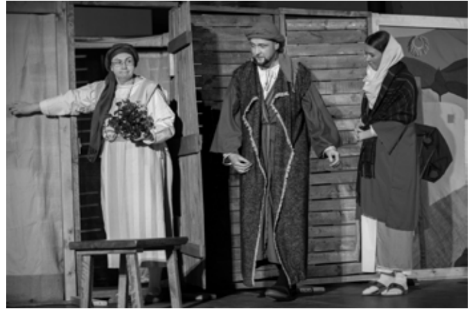
Muusikal "Valgus valguses"; Petlemma naine andmas öömaja Joosepile ja Maarjale.

Võib-olla soovib Jumal tuua sulle sel aastal õnnistuse just kahe Euroopa noore kaudu? Need noored pole lihtsalt turistid, vaid palverändurid erinevatest kirikutest. Ammusest ajast on teada, et palverändureid lubati ikka oma elamisse. Neile pakuti alati süüa ja