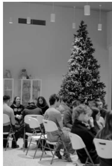
Vestlusgrupid kiriku fuajees.

Head tagasisidet andsid palverändurid selle kohta, kui laia valikut töötube noortekohtumise ajal pakuti.