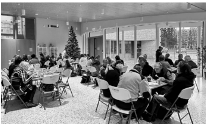
Sotsiaaltöö Keskuse jõululõuna.

Juba kolmandat korda peeti Mustamäe kiriku ruumides Tallinna Sotsiaaltöö Keskuse Akadeemia üksuse elanike jõulupidu. Sealsed töötajad teevad igal aastal kõik jõuluroad juba eelnevalt ise valmis, meil on vaja lauad katta ning programmi pakkuda. Ürituse jooksul loeti Piiblit ja lauldi jõululaule Maarja Vardja klaverisaatel. Ka siin ei jäänud pidu ilma Taizé puudutusest – öde Wendy pidas inspireeriva kõne ning mitmed vennad ja vabatahtlikud vestlesid pidulistega. Õhtu kõige lõbusamaks osaks kujunes sarnaselt eelmistele aastatele loterii.