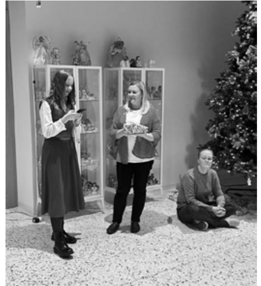
Laste etteasted.