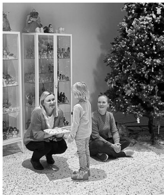
Laste etteasted.

Sel korral oli siis sedamoodi – igal peol midagi uut ja vana, aga peetud need said ning usutavasti tõi üheskoos veedetud aeg kõigile naeratuse näole.