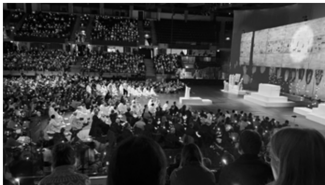
Tondiraba Jäähallis toimuv õhtupalvus, 30. detsember 2024.

Saime kindlasti osa ajaloolisest üritusest Eestis, mida ilmselt niipea taas meie riigis ei toimu. Siiski on võimalus veeta oma tuleviku aastavahetusi samas vaimus, järgmisena juba Pariisis ja samuti kogeda kodumajutuse õnnistust! Suur tänu veelkord kõigile, kes panustasid oma aega, energiat, oskusi ja armastust selle heaks, et Taizé palverändurid tundsid ennast selle noortekohtumise ajal Mustamäel, Tallinnas ja Eestis oodatuna ja hoituna!