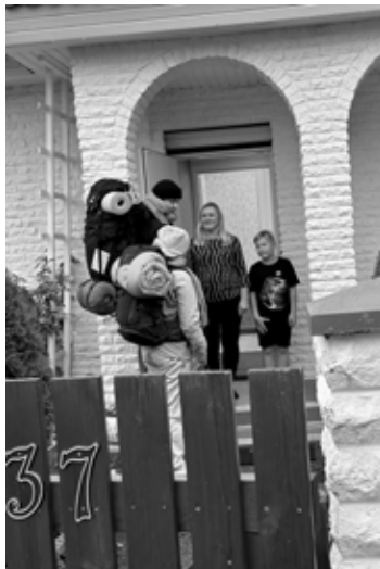
Marilini pere harjutamas palverändurite vastu võtmist.

26. detsembrist 1. jaanuarini majutasime Taizé aastavahetuse noortekohtumise raames meie kogudusse saabunud vabatahtlikke ja osalejaid, kokku 114 inimest - ca 77 osalejat elasid peredes ja meie keldrisaalis ööbis 14 noort. Tegime koostööd Mustamäe Vineyardi kogudusega, kuhu majutati 23 osalejat. Majutajaid oli kokku 32, lisaks veel seitse inimest, kes pakkusid aasta esimesel päeval