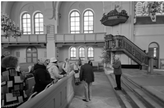
Rapla Maarja-Magdaleena kirik

Tagasisideringis pärast ühist õhtusööki mainisid mitmed meist, et on tänulikud ilusa ilma ja meeldiva seltskonna eest, neil oli põnev külastada uusi paiku ja kirikuid Eestimaal ja nad õppisid selle külaskäigu jooksul uusi asju või pani nähtu/kuuldu neid mõtlema. See päev andis ka palju ainet eestpalveteks, et rohkem inimesi leiaks tee kohalikku kirikusse ja et oleks piisavalt finantse kirikut ja kogudust üleval pidada ning teostada vajalikud remonttööd.