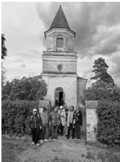
Lelle Püha Kolmainu kirik

Kolmandana jõudsimegi Järvakandi Pauluse kirikusse . Tegemist on väga kauni ja armsa, aga ka väikse kirikuga, et naljaga pooleks öeldes oli algul mure, kas me kõik sinna ära mahume! Tegelikult mahutab kirik vabalt 80 inimest ja seda nimetatakse oma väiksuse tõttu ka nukukirikuks. Meid oli tervitama tulnud koguduse raudvara - juhatuse esinaine ja mõned liikmed. Laes oli samuti rist, mis paljusid meist üllatas ja pani mõtlema, et kui kirikuõpetaja seisab koguduse ees, seisab ta samas ka Jeesuse risti all. Sealne kirik peab 16. augustil oma 30. sünnipäeva (kirik pühitseti