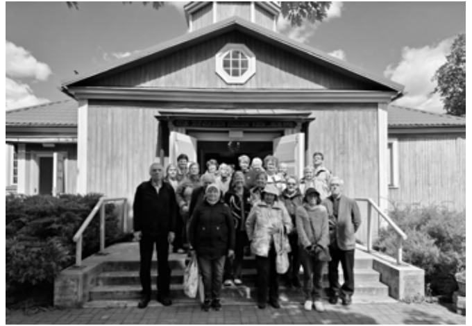
Järvakandi Pauluse kirik