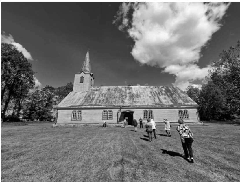
Mustamäe koguduse liikmed teel Kehtna Peetri kirikusse, 2026. a.

EELK Tallinna Toompea Kaarli koguduse õpetaja EELK Tallinna praostkonna praost